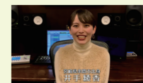
「日本のひなた宮崎県」サウンドロゴ制作 (2022) ★宮崎県

「いつもの安心」と「もしもの保障」を、お客さま一人ひとりのライフスタイルに合わせてご提案します。わかりやすく、丁寧に、あなたの想いをカタチにするお手伝いをしていきます。