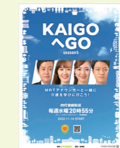
ひなたの介護情報発信事業 「KAIGO e GO!」 (2018~2022) ★宮崎県