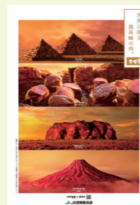
宮崎県産牛肉販売促進 プロモーション (2022) ★JA 宮崎経済連