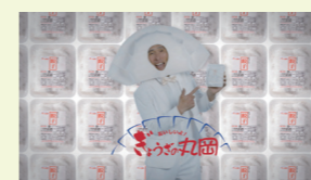
企業イメージCM (2022) ★有限会社ぎょうざの丸岡