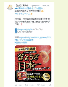
餃子2年連続日本一 Twitter キャンペーン (2022) ★宮崎市観光協会