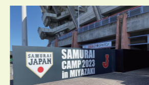
侍ジャパン宮崎キャンプ (2023) ★国内外代表合宿受入実行委員会