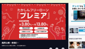
Tver 広告 (2022) ★高鍋信用金庫