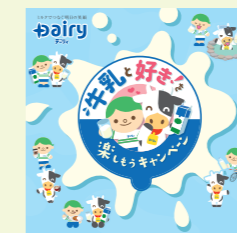
市乳キャンペーン (2022) ★南日本酪農協同株式会社